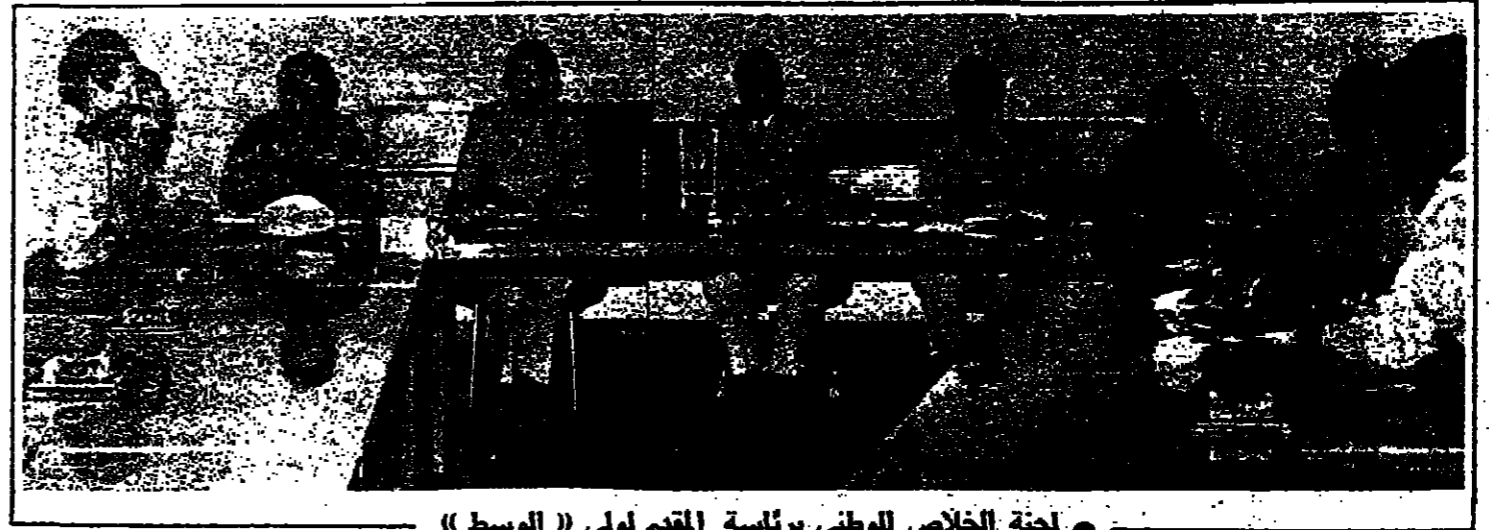
لجنة الخلاص الوطني برئاسة المقدم لولي (الوسط)